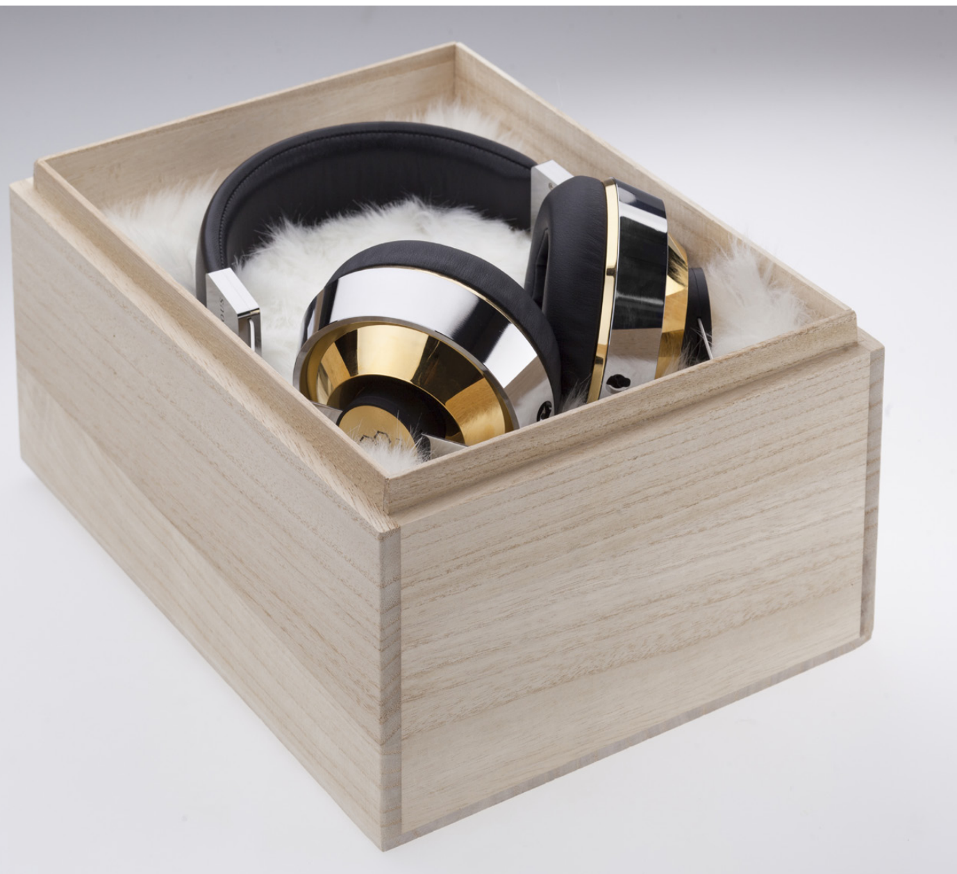
Головные телефоны Final Audio Design Sonorous X (399 000 ₽)

Технические характеристики (по данным производителя)