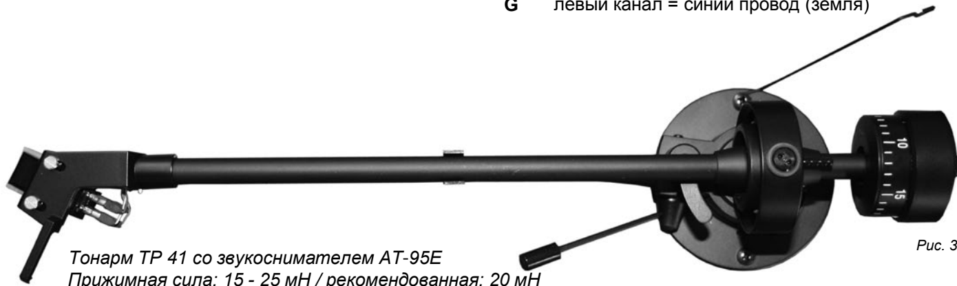
Тонарм TP 41 со звукоснимателем AT-95E Прижимная сила: 15 - 25 мН / рекомендованная: 20 мН